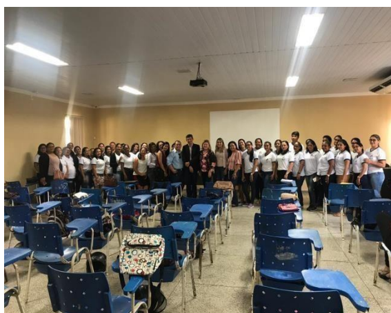
Turma ACS – Município Paragominas