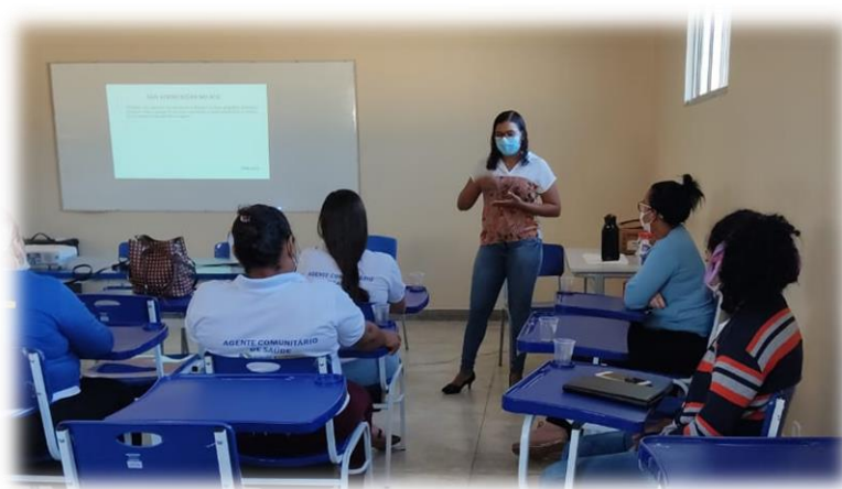
Orientação sobre os indicadores do Previne Brasil

Pau D'arco – Bannach - Água Azul do Norte - Xinguara - Rio Maria - Floresta do Araguaia