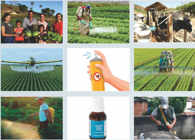
Agrotóxico agrícola, agrotóxico doméstico, agrotóxico da saúde pública, pulverização aérea, pulverização terrestre, agrotóxico na pecuária