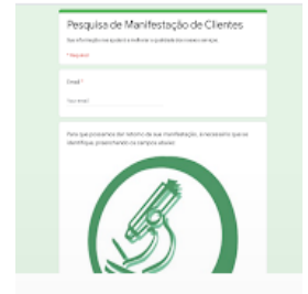
Pesquisa de Manifestaçã...

O link da pesquisa poderá ser também disponibilizado nas visitas técnicas, treinamentos e supervisões programadas pela DRLAB, sob a responsabilidade dos técnicos destacados para realizar tais atividades. A CQB avalia o conteúdo dos formulários preenchidos, havendo reclamações ou sugestões pertinentes, emite o Registro de Tratamento de manifestações – RTR. O setor responsável pela resposta ao cliente fará a análise da causa da manifestação, posteriormente retornará o registro a CQB com as devidas ações tomadas ou com o retorno a ser encaminhado para o cliente. A CQB fica responsável por devolver a resposta ao cliente.