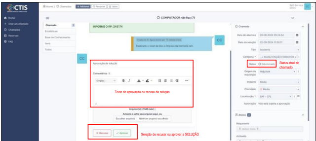
Figura 10 Chamado em status SOLUCIONADO, com pendência de aprovação ou não do usuário demandante.

4.8.1. O chamado saíra do status SOLUCIONADO para FECHADO após aprovação (feedback) do usuário demandante. Em caso de não aceitação, clicar em "recusar", devendo, obrigatoriamente, informar o motivo da recusa no campo "comentários".