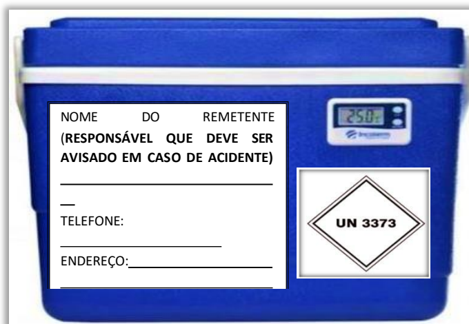
Fig. 7- Embalagem para transporte de substância biológica da categoria B