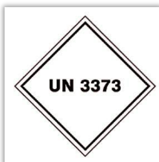
Fig. 6- Marca para identificar embalagens para transporte de substância biológica da categoria B

A marca UN 3373 deve ser exibida na superfície da embalagem externa, sobre um fundo de cor contrastante, e deve ser claramente visível e legível. A marca deve estar sob a forma de um quadrado fixado a um ângulo de 45° (em forma de losango), tendo cada um dos lados pelo menos 50 mm de comprimento; a largura da linha deve ser de pelo menos 2 mm e as letras e números devem ter pelo menos 6 mm de altura.