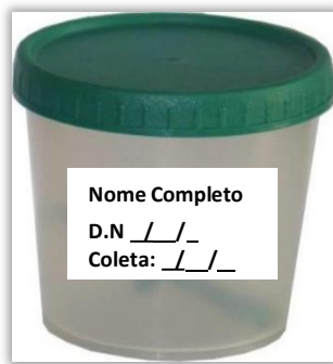
Fig. 1- Identificação adequada