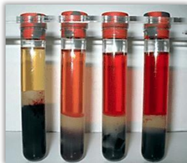
Fig. 8-Apresentação das amostras de sangue depois de centrifugada